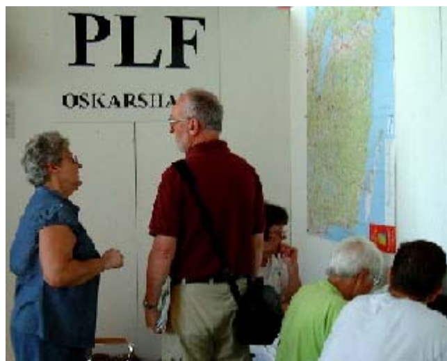
Hög aktivitet vid PLF:s monter i Borlänge