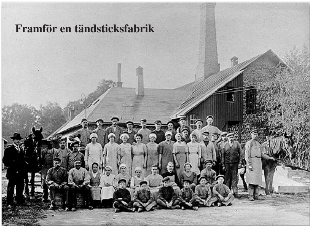
Framför en tändsticksfabrik

I mitten av 1800-talet hade flera industriella projekt utvecklats, och fabriker av olika slag etablerades överallt i landet. Spinnerier, pappersbruk, järnbruk och tändsticksfabriker växte fram i raskt tempo. Fattigfolkets söner och döttrar sökte sig nu till industrin, där deras arbetskraft hänsynslöst utnyttjades av fabriksägarna. Vi har här valt att koncentrera oss på tändsticksfabrikerna och den fruktansvärda arbetsmiljö som rådde där.