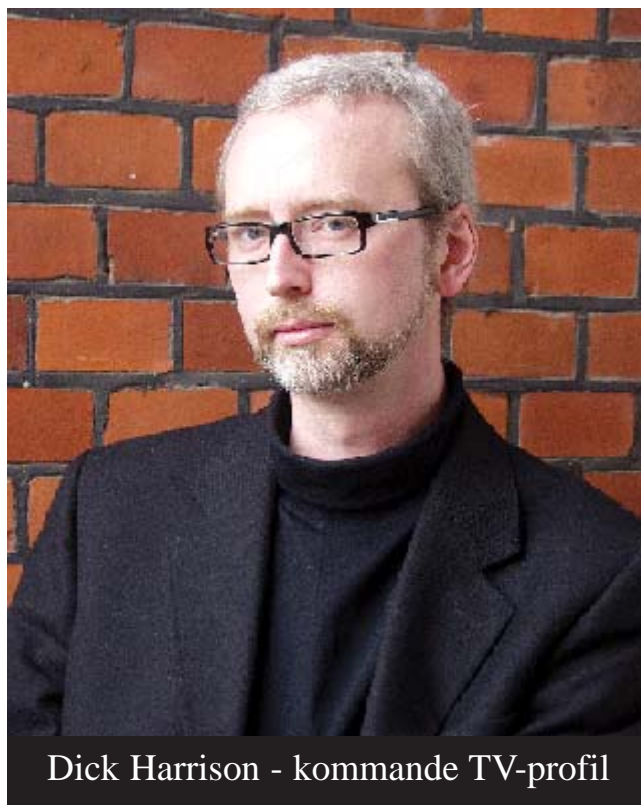
Dick Harrison - kommande TV-profil

"Det ska bli hela Sveriges historia, men även en del avsnitt från utlandet. Syftet är att visa spännande, underhållande och bra tv, som ska locka alla tittare", säger Dick Harrison. "Men vi kommer inte att servera gammal skåpmat. Vi ska helt enkelt lära