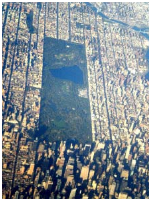
Manhattan med Central Park

Jamestown var bosättningsplats för en stor del av