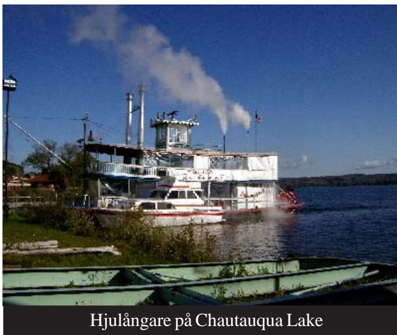
Hjulångare på Chautauqua Lake