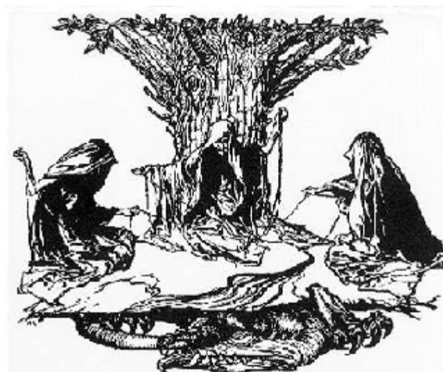
Nornorna spinner människans öde